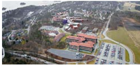
NY FJERNVARME: Her skal det nye fjernvarmeanlegget til Agder Energi ligge.

Agder Energi Varme har inngått avtale med Ugland Eiendom om levering av miljøvennlig fjernvarme til den nye HiA-campus, samt til Televeien 1, det tidligere Ericssonbygget.